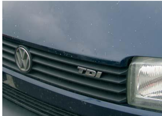
Aanvaardbaar op bedrijfswagens