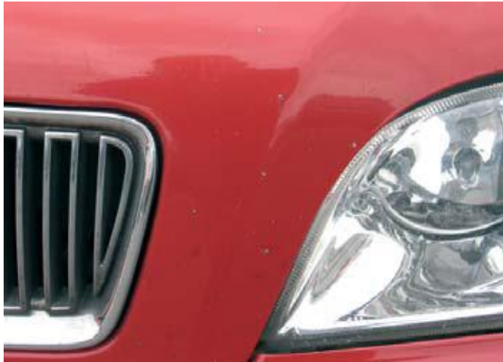
Aanvaardbaar bij meer dan 100.000 km