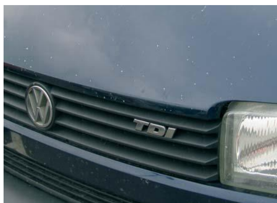
aanvaardbaar op bedrijfswagens