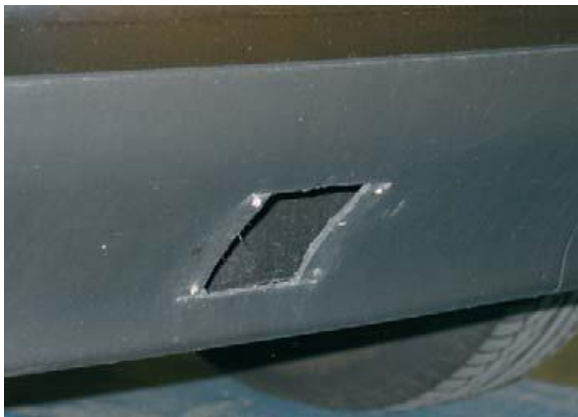
niet aanvaardbaar, trekhaak verwijderd

Schade als gevolg van het verwijderen van eigen accessoires is nooit aanvaardbaar.