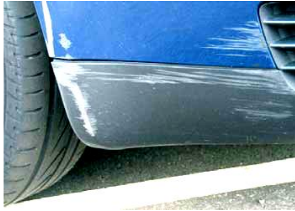
niet aanvaardbaar, door de lak heen