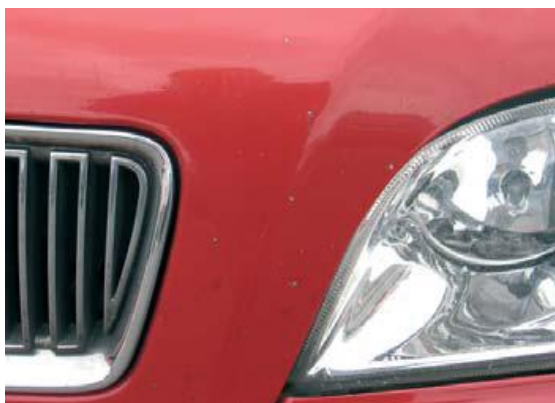
aanvaardbaar bij meer dan 100.000 km